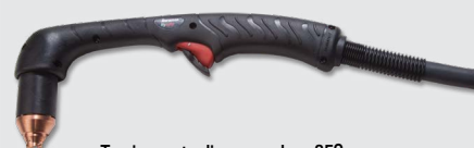
Torcia per taglio manuale a 85°

Stili di torce Duramax® Hyamp™ standard (per un numero maggiore di opzioni di torcia, consultare il sito Web www.hypertherm.com )